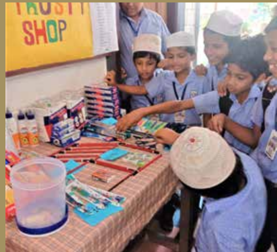
മാഹി ഒ ബാലിദ് മെമ്മോറിയൽ ഇംഗ്ലീഷ് ഹൈസ്കൂളിൽ ആരംഭിച്ച ട്രസ്റ്റി ഷോപ്പ്. ഷോപ്പിൽ നിന്നെടുക്കുന്ന സാധനങ്ങൾക്കുള്ള വില കാര്ട്ടുണിൽ നിക്ഷേപിക്കാം.