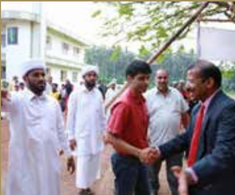
കണ്ണൂർ ജില്ലാകലക്ടർ ടി.വി. സുഭാഷ് ഐ എ എസ് വളപട്ടണം ക്രസന്റ് സ്കൂൾ ആർട്സ് ഫെസ്റ്റ് ഉദ്ഘാടന വേളയിൽ.