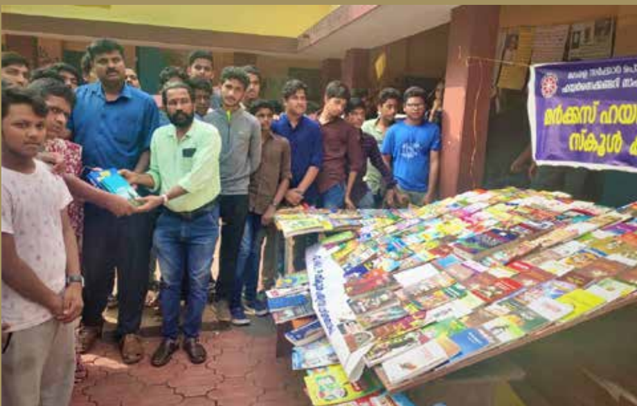
മർക്കസ് ഹയർ സെക്കണ്ടറി സ്കൂൾ എൻ എസ് എസ് വിദ്യാർത്ഥികൾ ശേഖരിച്ച പുസ്തകങ്ങൾ പൊയിൽതാഴം ഗവൺമെന്റ് എൽപി സ്കൂൾ ലൈബ്രറിയിലേക്ക് കൈമാറുന്നു.