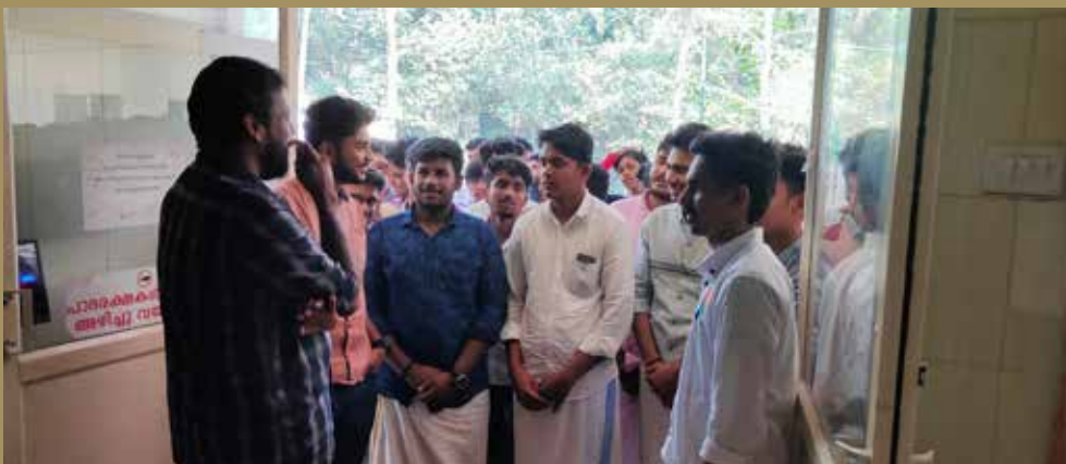
മർകസ് ഐ ടി ഐ വിദ്യാർത്ഥികൾ വയോജന സമ്പർക്കത്തിന്റെ ഭാഗമായി വൃദ്ധസദനം സന്ദർശിക്കുന്നു. വയോജനങ്ങൾക്ക് കുട്ടികളുടെ സന്ദർശനം ആശ്വാസമായി.