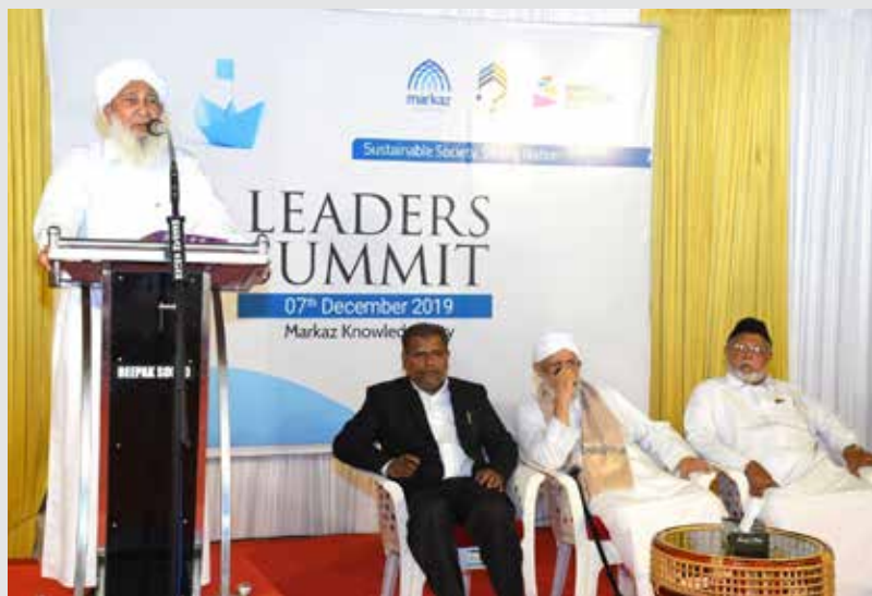
മർകസ് 43ാം വാർഷിക സമ്മേളനത്തിന്റെ ഭാഗമായി നോളജ് സിറ്റിയിൽ സംഘടിപ്പിച്ച സുന്നി സംഘടനകളുടെ സംസ്ഥാന നേതൃസംഗമം കാന്തപുരം എ.പി അബൂബക്കർ മുസ്ലിയാർ ഉദ്ഘാടനം ചെയ്യുന്നു.

മർകസ് നോളജ് സിറ്റിയിലെ കൾച്ചറൽ സെന്ററിൽ സംഘടിപ്പിച്ച സംസ്ഥാനതല നേതൃസംഗമം ഉദ്ഘാടനം ചെയ്തു