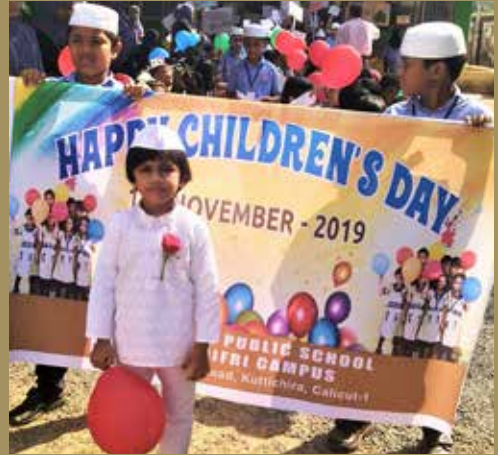
മർക്കസ് പബ്ലിക് സ്കൂളിൽ നടന്ന ശിശുദിനാഘോഷം