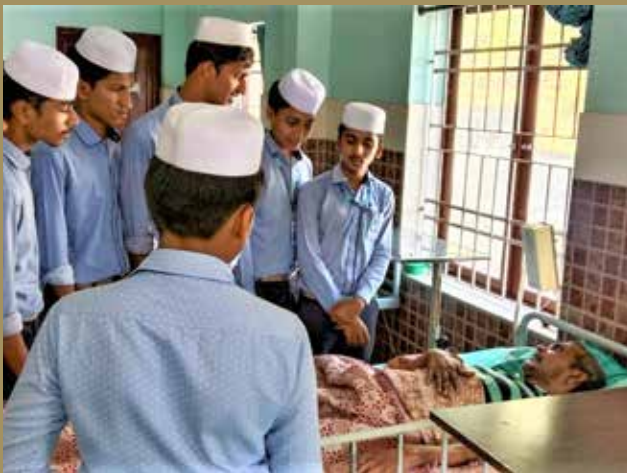
ബാല്യശ്ലേരി മർകസ് പബ്ലിക് സ്കൂൾ വിദ്യാർത്ഥികൾ വയോജന സമ്പർക്കത്തിന്റെ ഭാഗമായി നരിക്കുനി അത്താണി സന്ദർശിക്കുന്നു. 30-ഓളം വരുന്ന വയോജനങ്ങൾക്ക് കുട്ടികളുടെ സന്ദർശനം ആശ്വാസമായി.